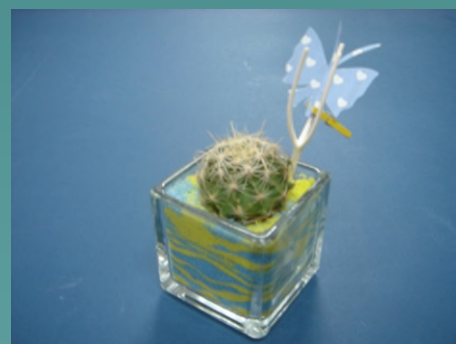
仙人掌植栽 小熊捧花