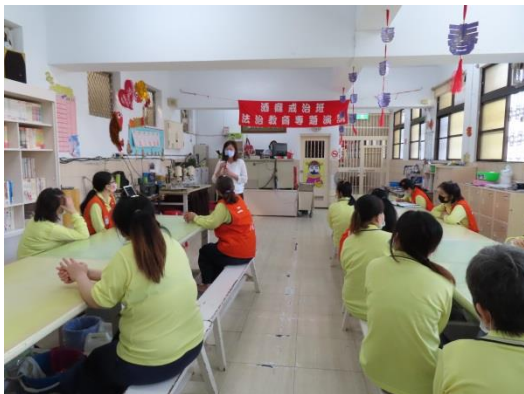
張講師宣導酒癮防治重點