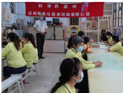
束醫師講解藥物成癮的危害