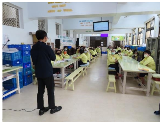
羅律師講述個案實例