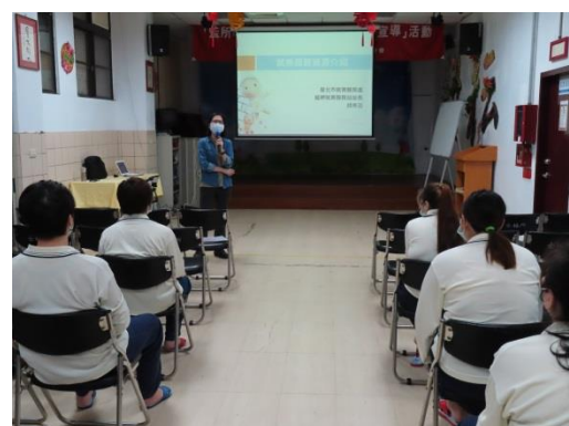
就業服務處郁站長說明職業訓練課程