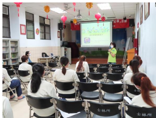
士林更保會黃主任解說就業服務資訊