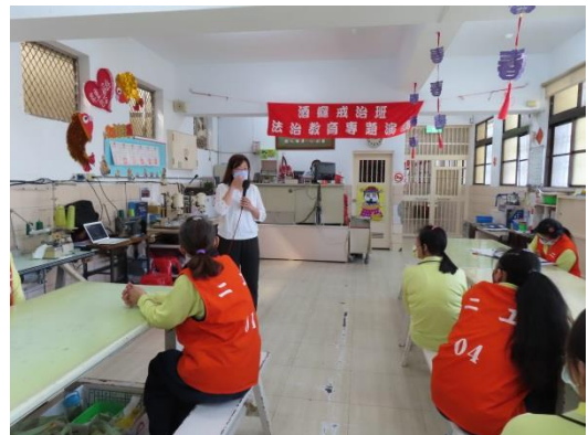
張講師講解避免酒精成癮