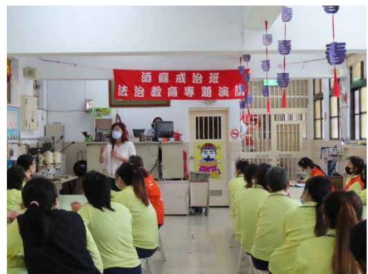
張講師講述酒癮對家庭的傷害