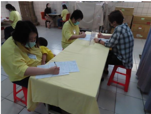
收容人認真填寫資料