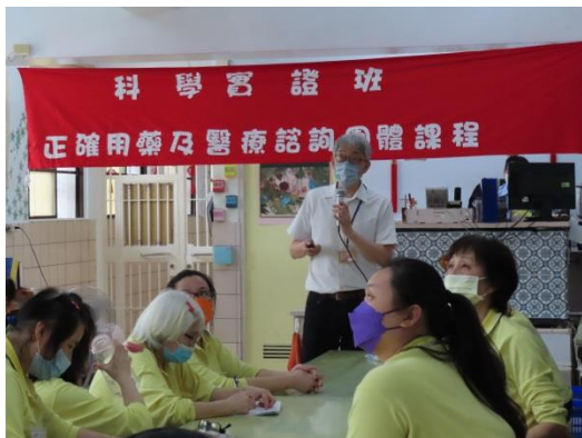
束醫師講述毒品危害