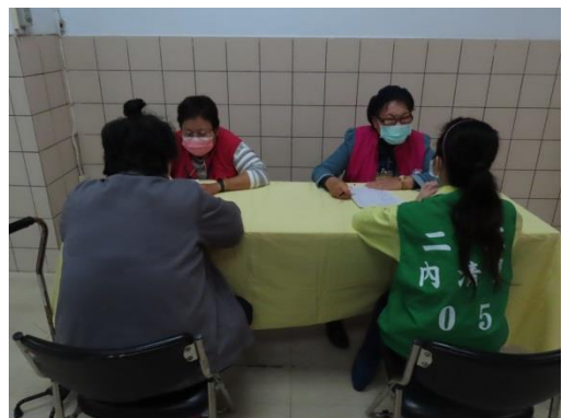
更生輔導員就業轉銜個別輔導