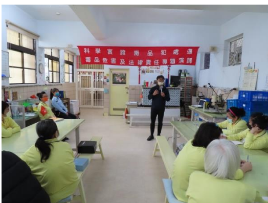
羅律師宣導法治教育