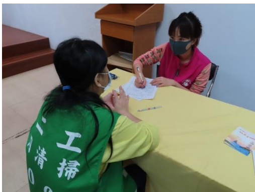
更生輔導員輔導情形