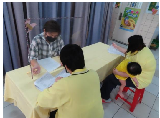
許個管師詢問個案出監資料