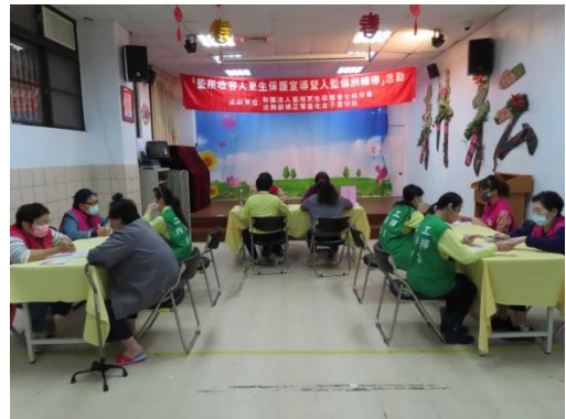
勞工局講師介紹就業資訊