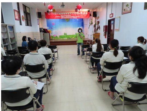
士林更保會黃主任介紹更生保護會