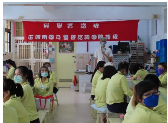
束醫師講解毒品對大腦的傷害