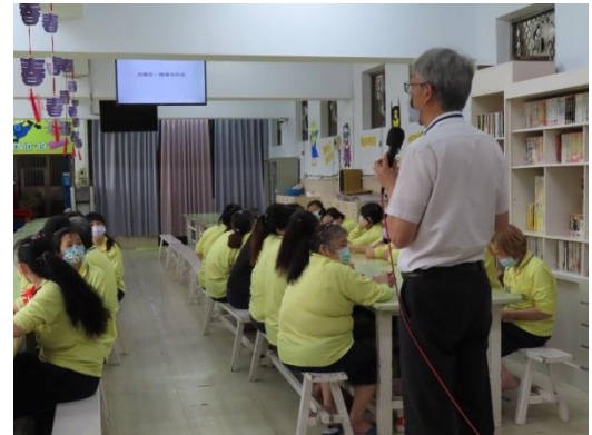
建立收容人拒毒相關的正確觀念