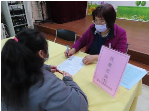
勞工局講師回答收容人問題