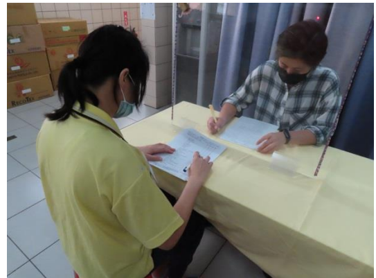
許個管師回答收容人提問