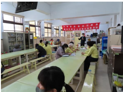
羅律師講述修復式司法