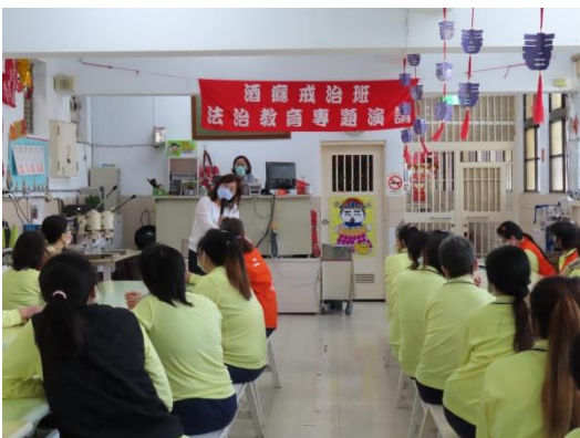
張講師分享與探討真實案例