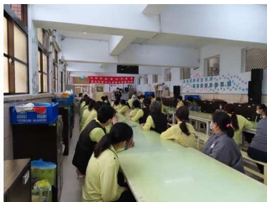
羅律師解答收容人法律問題