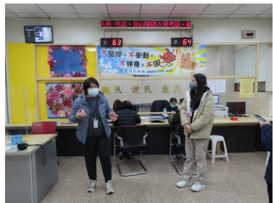
讓家屬了解家庭支持重要性