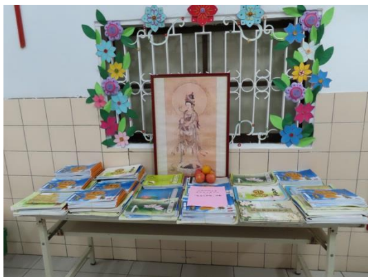
收容人認真抄寫經書