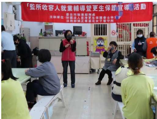
士林更保會黃主任介紹更生保護會