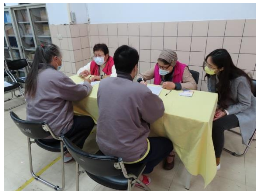
更生輔導員就業轉銜個別輔導