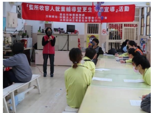
士林更保會黃主任解說就業服務資訊