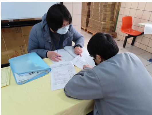
徐個管師解說收容人問題