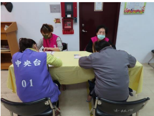
更生輔導員輔導情形