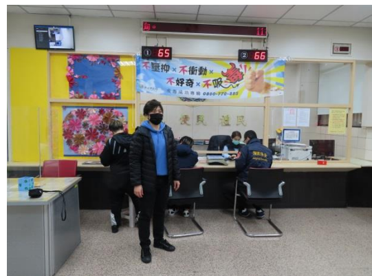
個管師宣導毒癮危害