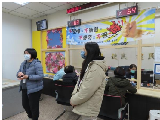
個管師回答接見家屬問題