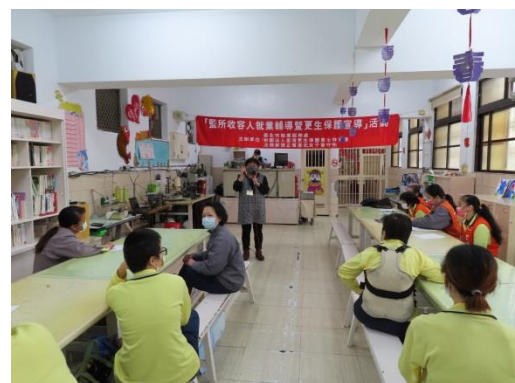
就業服務處蔡站長說明職業訓練課程