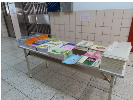
收容人認真抄寫經書