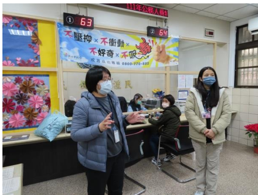
個管師宣導反毒知識