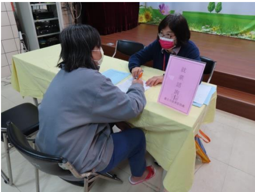
勞工局講師回答收容人問題