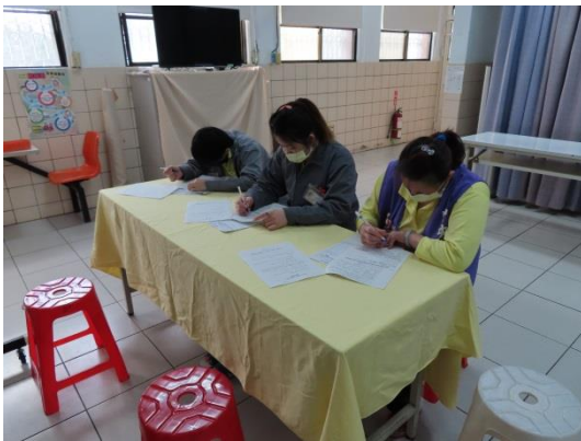
收容人認真填寫資料