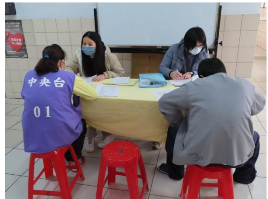
個管師回答收容人提問