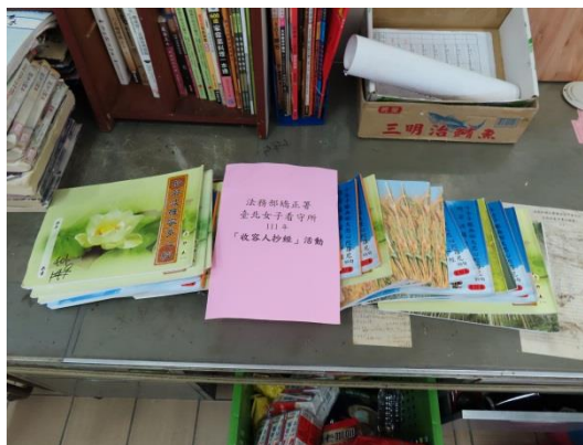
收容人認真抄寫經書