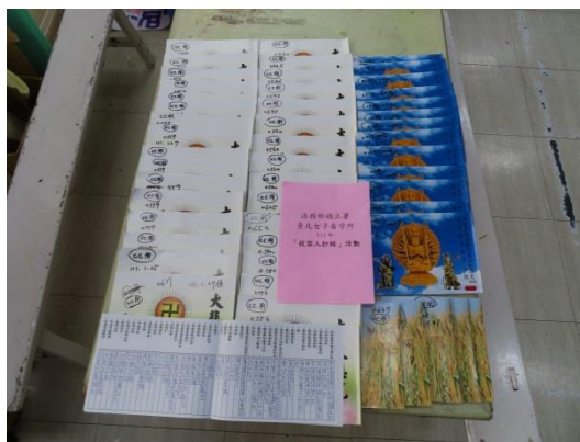
收容人認真抄寫經書