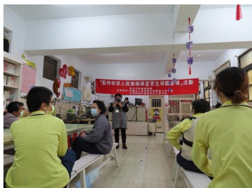
就業服務處蔡站長介紹就業事項