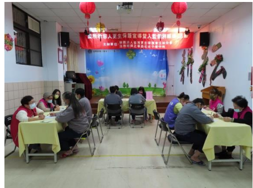
勞工局講師介紹就業資訊